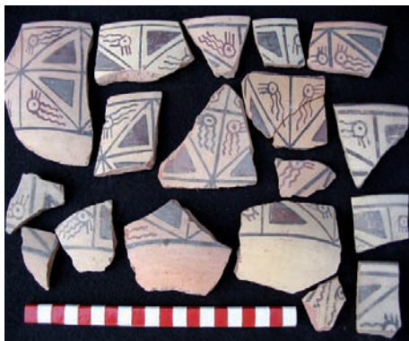
Figura 8. Cerámica del estilo Cajamarca proveniente del depósito de La Oroya.