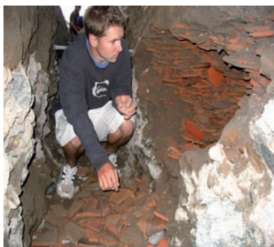
Figura 3. Vista del depósito de cerámica de La Oroya.

Debido a que la apertura de la zanja seguía su curso, el trabajo de rescate tenía que ser rápido para de esta manera minimizar la pérdida de pieza alguna. De este modo, el trabajo de excavación se completó en 3 días, resultando en la recuperación de un total de 37 bolsas de cerámica fragmentada. Cada bolsa pesa aproximadamente 40 kilos.