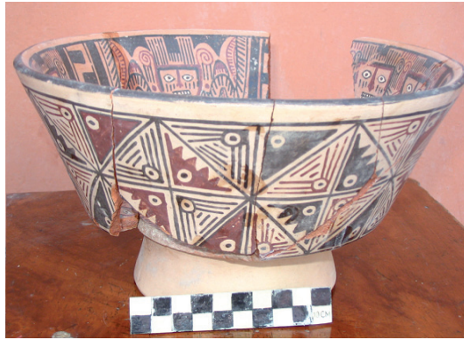
Figura 9. Vajilla en el estilo Cajamarca con su característica base pedestal proveniente del depósito de La Oroya.