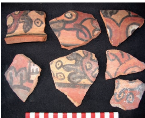
Figura 5. Cerámica del depósito de La Oroya con filiación ayacuchana. Figure 5. Ceramics from the deposit of La Oroya with highland Ayacucho origins.

La deposición en sí consiste de una acumulación de cientos de fragmentos de cerámica, generalmente gruesa. Esta sugiere que el hallazgo consiste de una ofrenda donde una serie de vasijas grandes fueron sacrificadas y enterradas. Estilísticamente, la decoración de los tiestos los vincula con la región de Ayacucho y con la cultura Wari en particular (Figura 5). Algunas muestras de las fotos tomadas de las piezas fueron posteriormente enviadas a Patricia Knobloch para su identificación estilística. De acuerdo a dicho reconocimiento, los tiestos son un derivado del estilo Chakipampa 1B (Figura 6). Knobloch también sostiene que las piezas de La Oroya guardan mucho en común con piezas recuperadas en el valle de Moquegua (ver, Owen & Goldstein 2000: Fig. 9). Esta observación confirma la inicial apreciación de Menzel (1964), quien efectivamente sostuvo que la incorporación del valle de Acarí al control Wari tomó lugar durante el Horizonte Medio 1B.