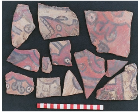
Figura 7. Cerámica decorada recuperada del depósito de La Oroya.

En cuanto a decoración se refiere, los motivos presentes en los fragmentos son los mismos o copias de aquellos que frecuentan en las vasijas Okros y Chakipampa del valle de Ayacucho, el centro de origen del Estado Wari. Sin embargo, las muestras de La Oroya no tienen la misma perfección y menos el fino acabado que las piezas encontradas en Ayacucho (Figura 7), aunque es notable el acercamiento entre ambos materiales, la misma que sugiere presencia de personal Wari dirigiendo la forma como los motivos debieron haberse ejecutado. Es decir, es posible que quienes manufacturaron y decoraron las vasijas fueron artesanos locales de Acarí, pero siguiendo las órdenes de oficiales Wari establecidos en Acarí.