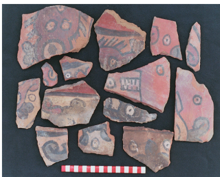
Figura 6. Cerámica del depósito de La Oroya con diseños Chakipampa 1B.