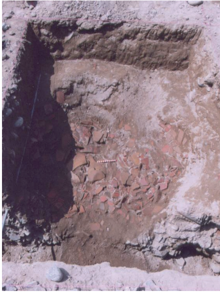
Figura 4. Excavación del depósito de cerámica.