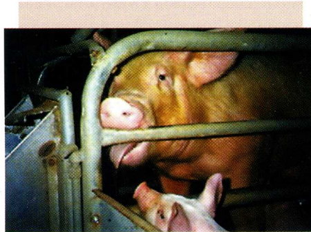
Cerda en jaula de lactancia mostrando una conducta estereotipada que consiste en morder las barras de la jaula en forma reiterada

El propósito de este artículo es dar una visión global de lo que está ocurriendo en el mundo desarrollado en relación al BA y discutir la necesidad de incorporar criterios de BA en nuestros sistemas productivos, teniendo en mente los actuales escenarios de globalización e internalización de mercados.